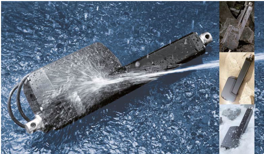
图1：新型Thomson Electrak HD电动推杆设计用于要求最大程度抵御固体、液体、极端温度、冲击、振动、腐蚀、电磁干扰等影响的工程机械应用。

作为一种提高性能、降低成本的手段，车载电子设备的问世促进了电动推杆在苛刻的户外应用中的推广。但是如果不采取特殊的措施保护零部件在各种恶劣环境中正常使用，就无法实现这些优势。本文将讨论电动推杆的主要环境威胁、测试电动推杆应对这些威胁能力的流程、以及为了提供这种能力所采取的设计特征。